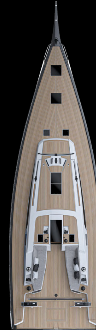
Top View GS 52 RACE