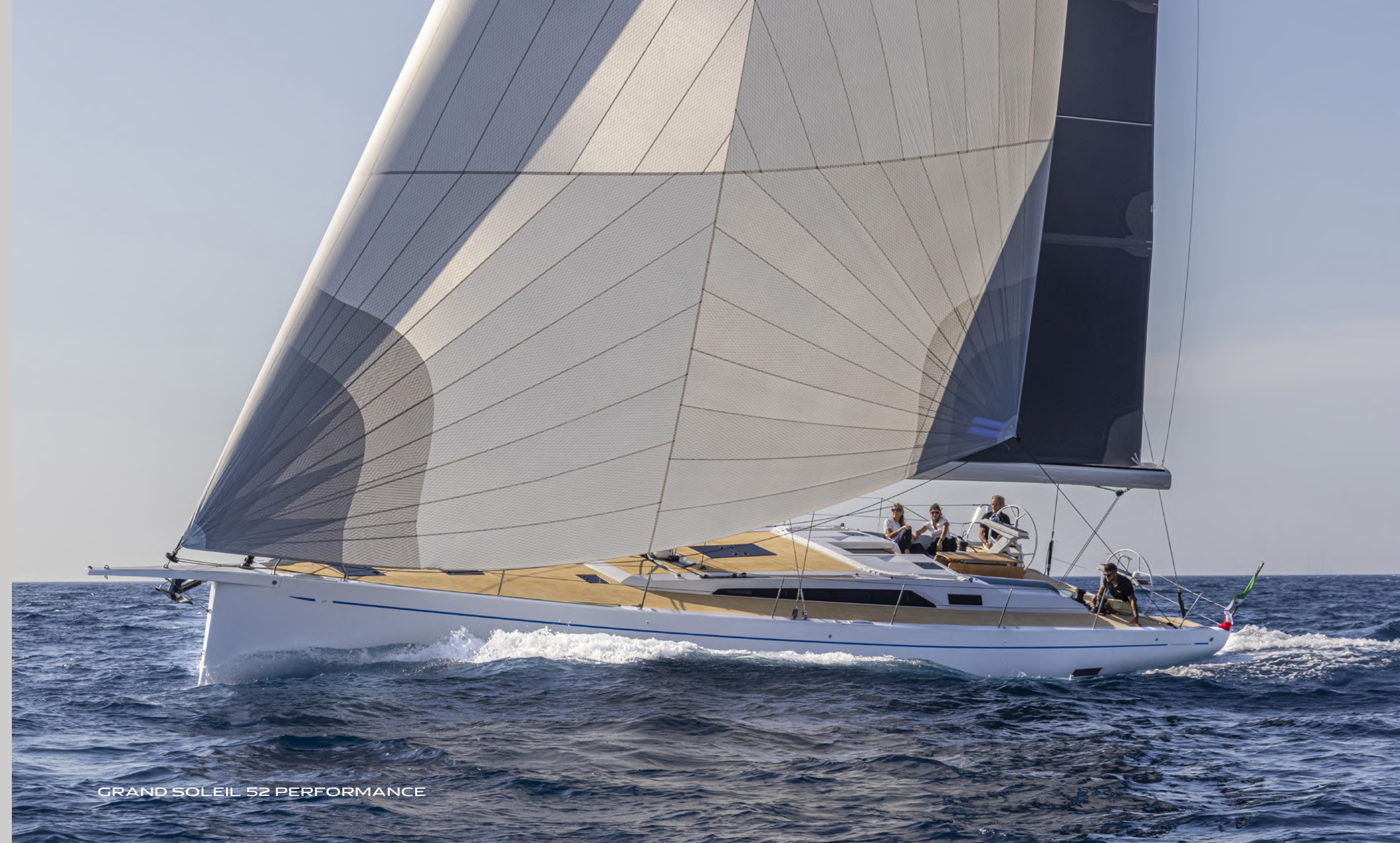
GRAND SOLEIL 52 PERFORMANCE