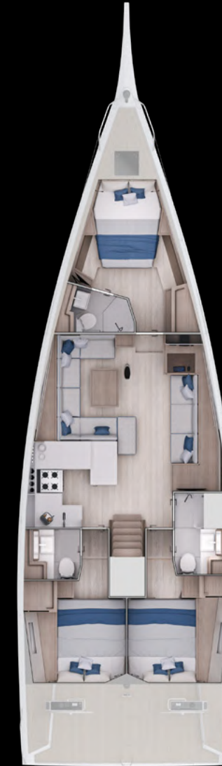
Interior View Std. GS 52 PERFORMANCE