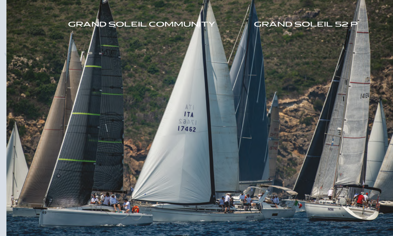
GRAND SOLEIL 52 P