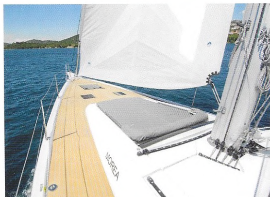
Kao kod puno većih jahti, ima veliko sunčalište na provi s biminijem i podesivim naslonom

Škota glavnog jedra je izmještena na rollbar a svi gindaci i škotine provedeni su do skiperske pozicije, pa je kokpit potpuno namijenjen uživanju