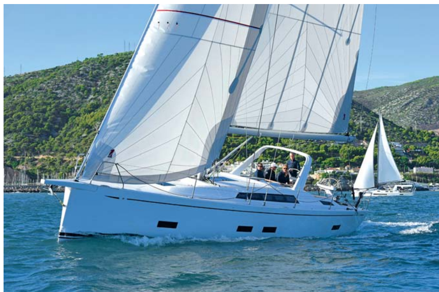
Joliment toilé. Les deux voiles sont montées sur enrouleur mais bénéficient de lattes verticales pour tenir leur chute. L'arceau souligne la vocation «croisière».